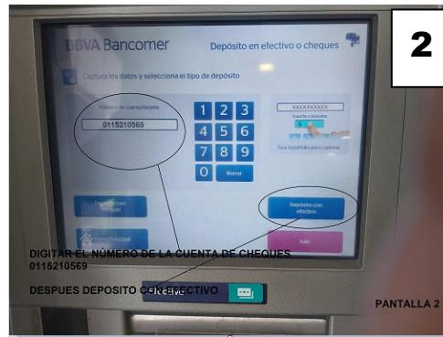
DIGITALIZA EL NÚMERO DE LA CUENTA DE CHEQUES. DESPUÉS DEPÓSITO.