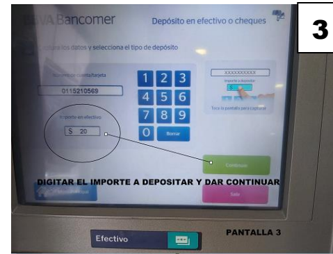
DIGITAR LA CANTIDAD A DEPOSITAR Y DAR CONTINUAR.